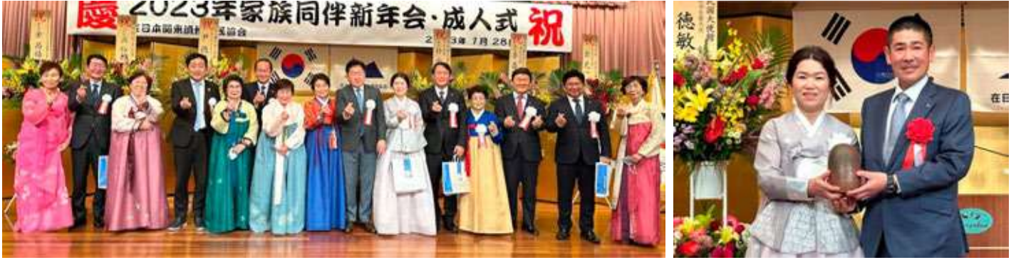
《各機関長と婦人会のプレゼント交換》