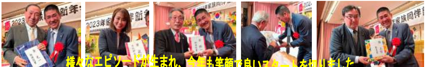
様々なエピソードが生まれ、今年も笑顔で良いスタートを切りました