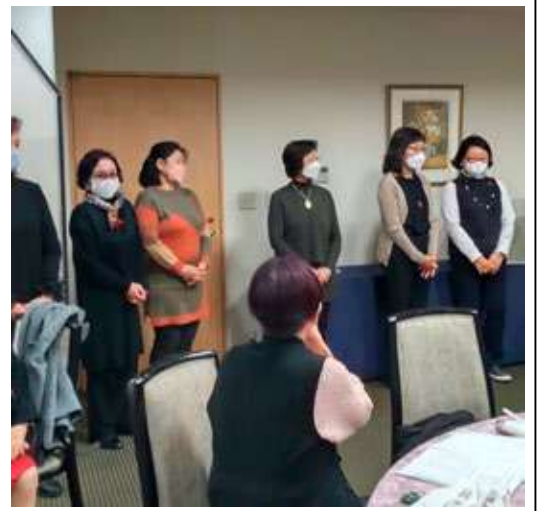
↑ 新しく加わった仲間を紹介